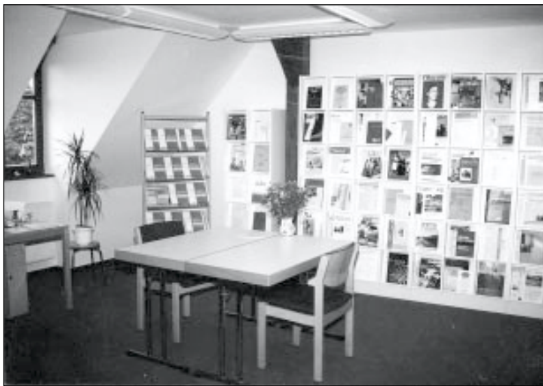
Zeitschriftenbereich der HoF-Bibliothek

Teil II der Literaturdatenbank umfasst den Zeitraum von 1990 bis zur Gegenwart mit derzeit ca. 15.000 Nachweisen. Mit Hilfe einer dreijährigen DFG-Förderung konnte der Anschluss an den Teil 1 der Literaturdatenbank hergestellt werden. Dabei wurden die Datenbankstruktur erweitert (Konferenz-, statistische- und Kontakt-Angaben neu) und die inhaltlichen Erschließungsmittel neu