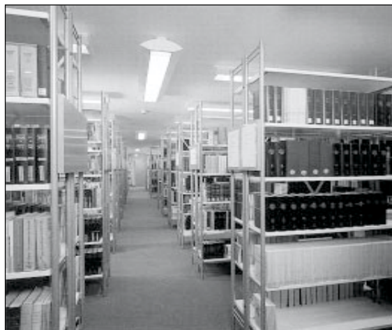
HoF-Bibliothek im Südlügel der Leucorea

Das Institut für Hochschulforschung Wittenberg verfügt über einen leistungsfähigen Informationsservice, der von den HoF Wissenschaftlerinnen und -Wissenschaftlern ebenso wie von auswärtigen Nutzern sehr geschätzt wird.