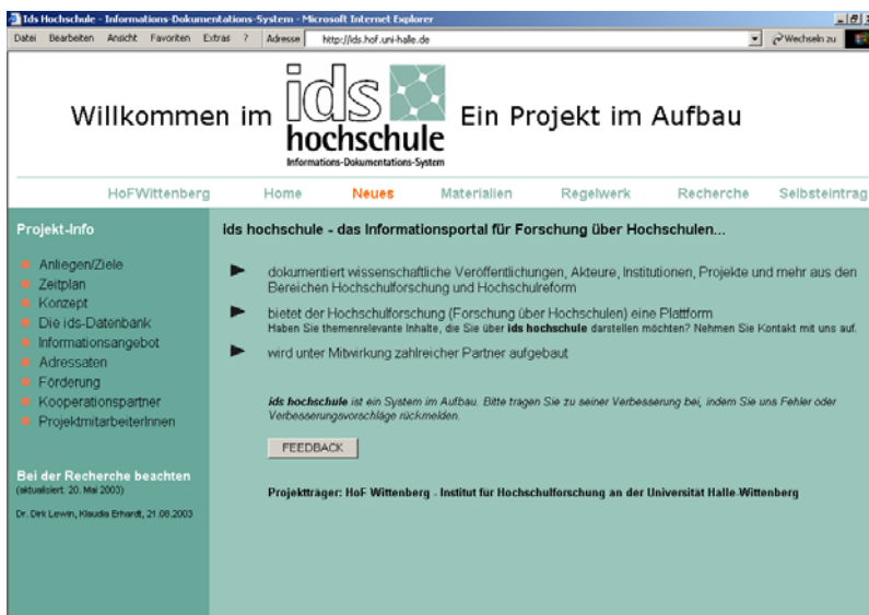
Abbildung 1: Startseite von ids hochschule – http://ids.hof.uni-halle.de

rInnen und alle, die sich für Hochschulen interessieren. Angesprochen sind daher auch die AkteurInnen des Reformgeschehens an den Hochschulen, EntscheidungsträgerInnen und MitarbeiterInnen in bildungs- und hochschulpolitischen Institutionen, der wissenschaftliche Nachwuchs sowie MitarbeiterInnen im Wissenschaftsservice (Informationseinrichtungen und Bibliotheken, Pressestellen, Verlage etc.).