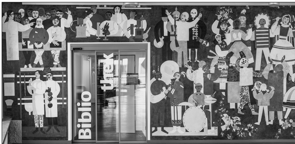
Abb. 1: Wandbild „Völkerfreundschaft“, Hans Rothe, 1964, Scagliola, 3,55 x 16,90 m

Daneben fallen unter den Bildern die Industrielandschaften auf, die die Industrialisierung in der DDR und vor allem in unmittelbarer Nähe der Technischen Hochschule reflektieren. Unverhohlen zeigen einige Bilder auch die Eingriffe in die Natur, was bisweilen auch bedrohlich wirkt. Die Landschaftsbilder und die Stillleben dieser Sammlung sind aber auch ein Zeichen dafür, dass die Mitarbeiter, die diese Gemälde in ihren Büros täglich betrachteten, eher dekorierende Kunst bevorzugten.